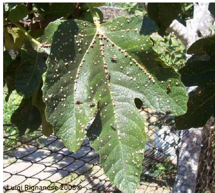
الإصابة على الأوراق (تتركز على العروق الوسطى)

وتوجد الإناث بأعداد كبيرة على الأغصان والأوراق عند العروق الوسطى؛ مما يسهل امتصاص العصارة النباتية، ويؤدي إلى إضعاف النبات. وقد تهاجم الثمار عند الإصابة العالية؛ فيصبح حجم الثمرة صغيراً، ويتشوه منظر الثمرة، مما يجعلها غير قابلة للاستهلاك. وتفترز الإناث كميات كبيرة من الندوة العسلية؛ فينمو عليها الفطر الأسود؛ الأمر الذي يقلل من تنفس النبات ويحد من القيام بالتمثيل الكلوروفيلي؛ مما يجعله عرضة للإصابة بحشرات أخرى.