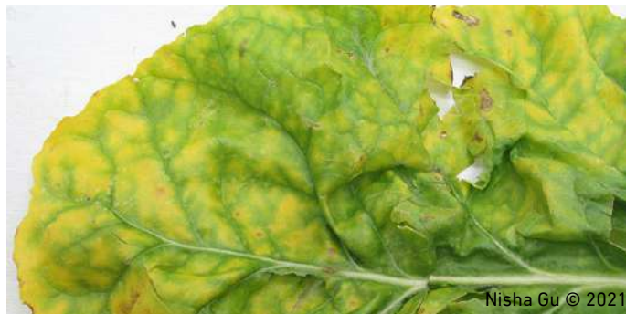
Nisha Gu © 2021

تشكل الأمراض التي تسببها الفيروسات ما نسبته 47% من مجموع الأمراض الجديدة التي تصيب المحاصيل الزراعية وتهدد الأمن الغذائي العالمي، ويعتمد قرابة 70% من الفيروسات التي تصيب النباتات (العائل) في انتقالها وانتشارها على الحشرات الماصة (الناقل) وخاصة المن والذبابة البيضاء المسؤولين عن نقل أكثر من 50% من تلك الفيروسات مسببةً النسبة الأعلى من الأضرار الاقتصادية لقطاع الإنتاج النباتي عالمياً.