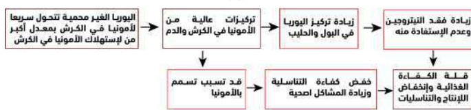
مزايا إستخدام اليوريا تدريجية الذوبان في عليقة ماشية الحلاب والتسمين

توفر اليوريا تدريجية الذوبان قيمة غذائية وإقتصادية للماشية من خلال توفير الإمداد المتزن من اليوريا تدريجية الذوبان على مدار 8 ساعات في الكرش، بما يسمح باستبدال آمن وفعال لفول الصويا في العليقة مع رفع جودة العليقة عن طريق زيادة البروتين المهضوم في الكرش. ونتيجة لذلك يرتفع هضم البروتين في العليقة وتحسن صحة الكرش ويزيد إنتاج البروتين الميكروبي وترتفع معدلات التحويل في ماشية التسمين ويزيد إنتاج الحليب وتركيز البروتين في الحليب في ماشية الحلاب بما يعود على المربي بتحسين الصحة العامة في القطيع وزيادة العائد الإقتصادي.